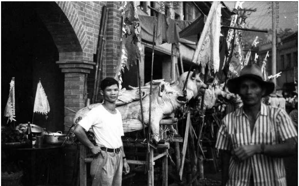
圖 9 李增昌，〈北埔義民節〉，1959，尺寸不詳，攝影照片，客家文化資產數位網。