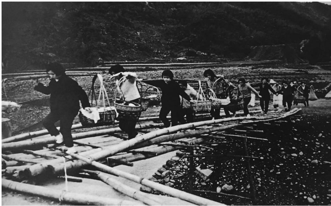
圖 6 李增昌，〈有妹莫嫁大山背〉，1960，尺寸不詳，攝影照片，客家文化資產數位網。

新竹李增昌以時代的眼睛，忠實客觀的紀錄客庄生活的人事景物，見證社會發展的軌跡，值得一提的是，筆者發現攝影家鏡頭下的被攝者，有許多都是為勞動中的客籍婦女，傳統客家婦女自小就需學習做「四頭四尾」，包含：「家頭教尾」整理家務，照顧公婆，養兒育女。「灶頭鑊尾」燒飯煮菜，割草砍柴。「田頭地尾」播種插秧、駛牛耕田、鋤草施肥，收穫五穀。「針