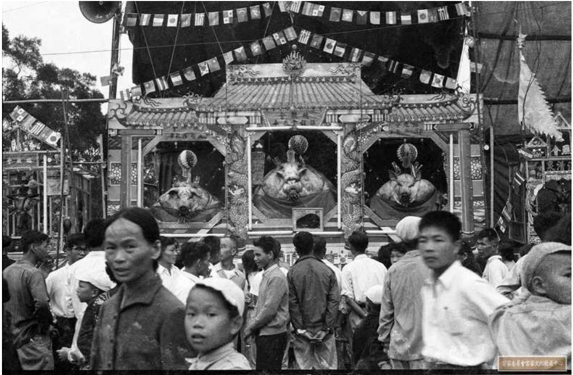
圖 8 李增昌，〈五和宮慶成福醮大神豬〉，1961，尺寸不詳，攝影照片。