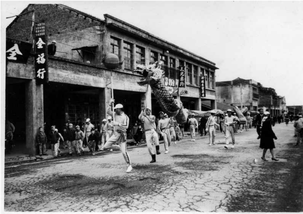
圖 10 李增昌，〈舞龍表演〉，1965，尺寸不詳，攝影照片。

早期客家族群為抵禦外族或防範土匪猛獸，保護墾地，常由庄頭的仕紳或族長出資，聘請有武術經驗的師傅，在當地廟宇或廣場教導傳授年輕一輩，學習武術，除了強身健體外，也配合年俗節慶，亦會聚集民眾練習舞龍、舞獅或其他藝陣。