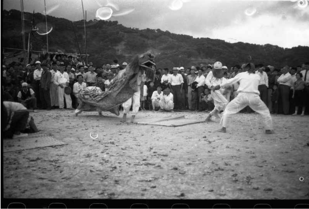
圖 7 李增昌，〈客家獅〉，1965，尺寸不詳，攝影照片。

【圖 8】〈五和宮慶成福醮大神豬〉、【圖 9】〈北埔義民節〉，則是記錄了客家族群敬獻祭品的主角，神豬。傳統上，客家族群認為將神豬養到越肥越大，才越能突顯敬俸給神明或好兄弟的誠意，從挑選、飼養、宰殺到裝飾，都必須經過特殊儀式，赴賦予神豬靈性，且飼養時有相當多禁忌，如不能亂說話、不能隨意讓外人看，總之要相當細心飼養神豬，讓牠吃好住好，平安長大。