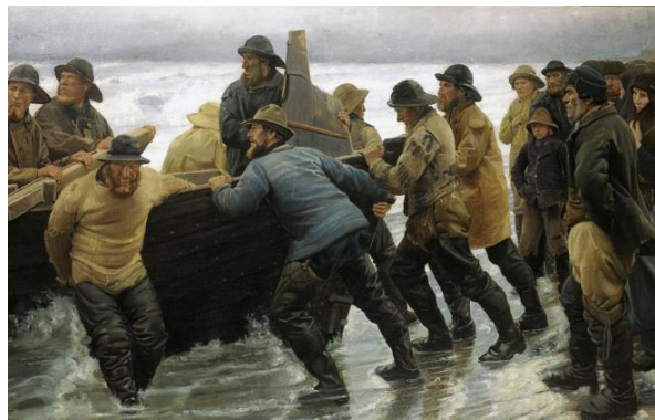
圖 15 邁可·安切爾，〈漁民發動划艇〉，1881，油彩、畫布，120×183 cm，斯卡恩博物館。

邁可於 1882 年拜訪維也納，這趟旅程造成他使用的色彩改變。因為他參觀到藝術史博物館的荷蘭藝術大師們，尤其是維梅爾的畫作，為他留下深刻印象，透明用色、嚴謹構圖、以及對光影的巧妙運用，啟發了他之後的繪畫風格。 28