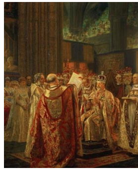
圖 23 勞瑞茲·圖森，〈愛德華七世國王加冕(1841-1910)〉，1904，油彩、畫布，173×141.1 cm，皇家收藏信託。