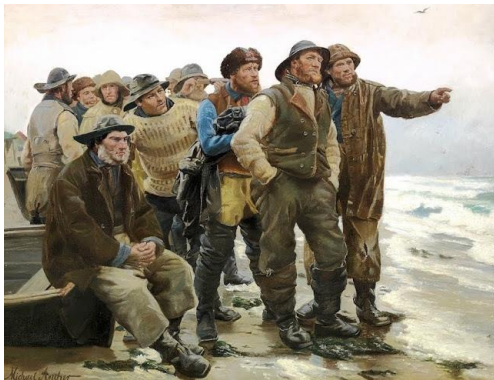
圖 14 邁可·安切爾，〈他會繞過去嗎？〉，1879，油彩、畫布，93×109.7 cm，斯卡恩博物館。

邁可於 1874 年初次抵達斯卡恩，因與本地人安娜結婚而於 1880 年定居，斯卡恩的風景以及漁民在惡劣的自然環境中勞動的題材，展現著他的個人特色。1879 年〈他會繞過去嗎？〉【圖 14】，站在岸上的漁民注視著畫面之外，若與標題結合來解讀，似乎是定睛關心著遠方移動的船隻能否順利繞過岸邊不會擱淺。邁可在這張圖畫中捕捉了漁民反應的瞬間，每個人的臉部特徵亦被清楚描繪。1881 年〈漁民發動划艇〉【圖 15】，一群漁民將船推入波濤洶湧的大海，圍觀的家人或朋友站在海灘上。邁可並未直接畫出海洋驚濤駭浪的景色，但是透過漁民嚴肅的眼神、推動船隻時竭盡全力的肢體動作，以及圍觀人群忍不住抓著衣領的緊張模樣，將遠方的危險與嚴寒氣溫表現在畫作中。