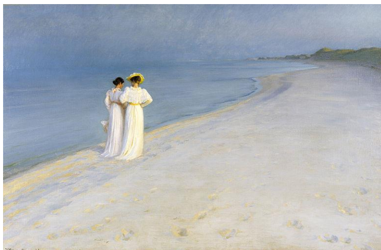
圖 13 索倫·柯羅耶，〈夏天傍晚在斯卡恩桑德斯坦〉，1893，油彩、畫布，100×150 cm，斯卡恩博物館。