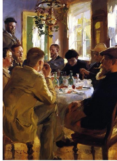
圖 8 索倫·柯羅耶，〈藝術家在布萊頓旅店的午餐聚會〉，1883，油彩、畫布，67.5×76.5 cm，斯卡恩博物館。