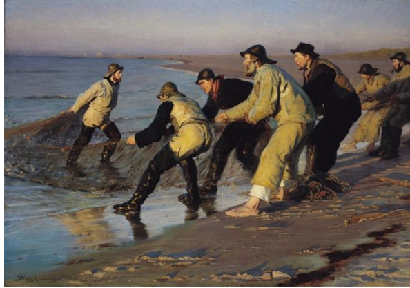
圖 6 索倫·柯羅耶，〈下午，漁民在北邊海灘拖網〉，1883，油彩、畫布， 135×190.5 cm，斯卡恩博物館。

1882 年至 1883 年間，柯羅耶的繪畫風格越加帶有印象派的色彩，當時另一位時常來訪斯卡恩的畫家克里斯蒂安·克羅格(Christian Krohg, 1852-1925)也從巴黎回來斯卡恩，克羅格在 1881 年底左右於對印象派風格的吸取，對其他斯卡恩畫家產生影響， 25 藝術家們也開始嘗試使用「粉彩」這個能快速捕捉光線色彩的媒材。【圖 7】柯羅耶 1883 年〈藝術家在布萊頓旅店的午餐聚會〉【圖 8】及之後作品如〈嘻，嘻，嘩！〉【圖 9】，其顏色和構圖線條都更清楚地以印象派技法為藍本，描繪藝術家友人之間交流同樂的情誼，或一起狩獵射擊的娛樂，若將〈嘻，嘻，嘩！〉與 1881 年為海因里希·赫施普朗家族畫的作品【圖 10】相比擬，可發現柯羅耶對於光的處理更加強調光影掠動及色彩分割的技法。