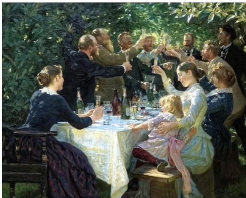
圖 9 索倫·柯羅耶，〈嘻，嘻，嘩！〉，1888，油彩、畫布，134.5×165.5 cm，哥特堡美術館。