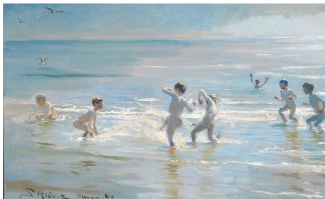
圖 12 索倫·柯羅耶，〈男孩們夏天傍晚在斯卡恩海灘沐浴〉，1892，油彩、畫布，38.5×60.5 cm，私人收藏。