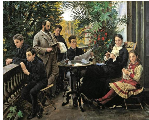
圖 10 索倫·柯羅耶，〈赫施普朗家族的肖像〉，1881，油彩、畫布，109.5cm×135 cm，赫施普朗博物館。

1889 年與瑪莉·柯羅耶(Marie Krøyer, 1867-1940)結婚後，瑪莉成為他主要的創作主題，並且在 1880 年代末期到 90 年代初期，柯羅耶描繪一系列藍紫色調為主的在斯卡恩海灘的畫作。【圖 11】【圖 12】【圖 13】與此同時，他於 1882 年至 1904 年哥本哈根新成立的「藝術家自由學校」擔任老師，授課靈感來自他在巴黎經過的種種學習， 26 以和丹麥皇家美術學院的過時政策