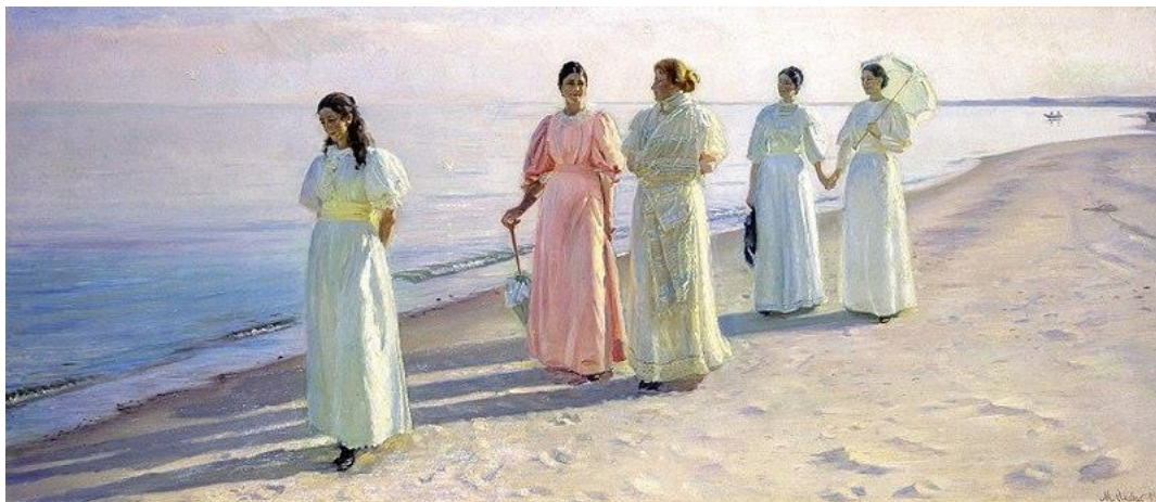
圖 16 邁可·安切爾，〈沙灘漫步〉，1896，油彩、畫布， 69×161 cm，斯卡恩博物館。

坦海灘散步》【圖 17】是臨摹〈夏天傍晚在斯卡恩桑德斯坦〉【圖 13】中柯羅耶的作畫方法，可見到邁可對於新技法的學習與嘗試。但是在邁可大部分的作品裡，依舊可見到他一貫保持著相當細膩的筆觸與分明輪廓。