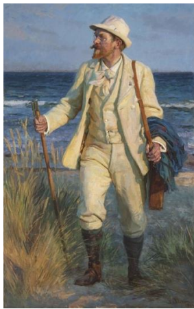
圖 24 勞瑞茲·圖森，〈畫家索倫·柯羅耶的肖像〉，1904，油彩、畫布，184.3×116.8 cm，匈牙利國家美術館。