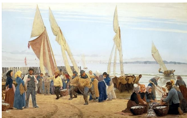
圖 2 索倫·柯羅耶，〈霍恩貝克的早晨：漁民上岸〉，1875，油彩、畫布，106.7×161.5 cm，赫施普朗博物館。