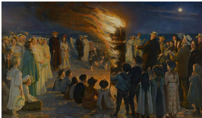
圖 31 索倫·柯羅耶，〈仲夏夜斯卡恩的海灘篝火〉，1906，油彩、畫布，149.5×257 cm，斯卡恩博物館。