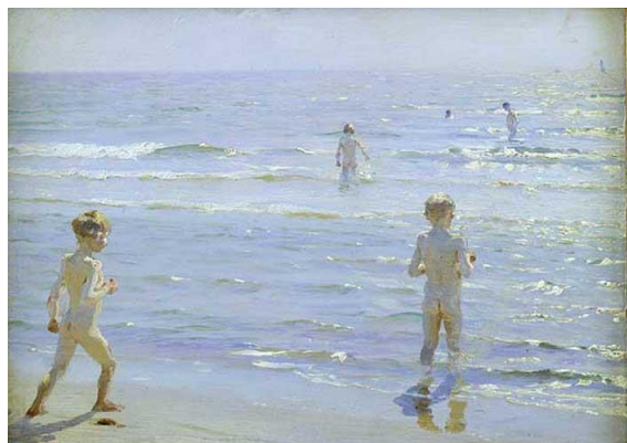
圖 11 索倫·柯羅耶，〈沐浴的男孩們〉，1892，油彩、畫布，23.7×33 cm，赫施普朗博物館。