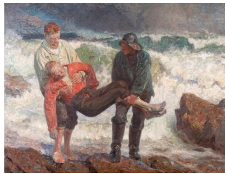
圖 27 勞瑞茲·圖森，〈溺水男孩被救上岸〉，1913，油彩、畫布，178×233 cm，斯卡恩博物館。