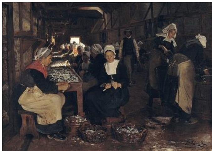
圖 3 索倫·柯羅耶，〈孔卡爾諾的沙丁魚廠〉，1879，油彩、畫布，101.5×140.5 cm，奧爾胡斯美術館。

工作，完成了繪畫〈孔卡爾諾的沙丁魚廠〉【圖 3】，描繪布列塔尼婦女們在擁擠昏暗的空間裡默默清潔著沙丁魚，以明暗對比凸顯重點，桌面與地上籃裝的沙丁魚，與婦女頭身上的白色領巾、頭巾，成為畫面少數明亮之處。