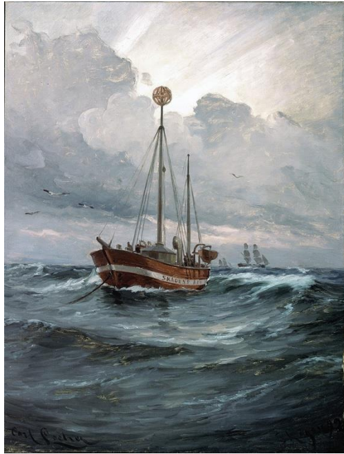
圖 21 卡爾·洛歇〈斯卡恩的燈船〉， 1892，油彩、畫布，114.3×87.6 cm， 斯卡恩博物館。