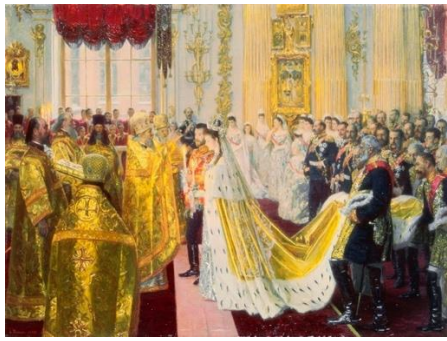
圖 22 勞瑞茲·圖森，〈尼古拉二世和亞歷山德拉·費奧多羅夫娜的婚禮〉，1895，油彩、畫布，65.5×87.5 cm，埃爾米塔日博物館。