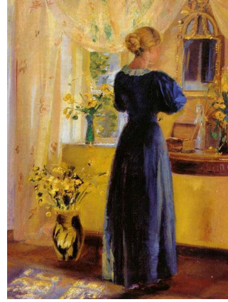
圖 20 安娜·安切爾，〈鏡子前的年輕女子〉，1899，油彩、畫布，40.1×32.7 cm，赫施普朗博物館。