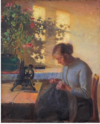
圖 19 安娜·安切爾，〈縫紉中的漁夫妻子〉，1890，油彩、畫布，59×48 cm，蘭德斯美術館。