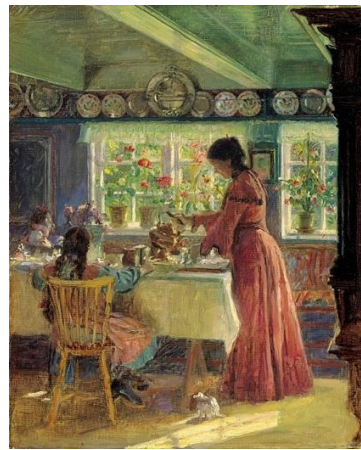
圖 25 勞瑞茲·圖森，〈倒杯早晨咖啡〉，1906，油彩、畫布，54×44 cm，斯卡恩博物館。