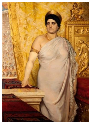
圖 5 索倫·柯羅耶，〈梅薩琳娜〉，1881， 油彩、畫布，142×102 cm， 哥特堡美術館。