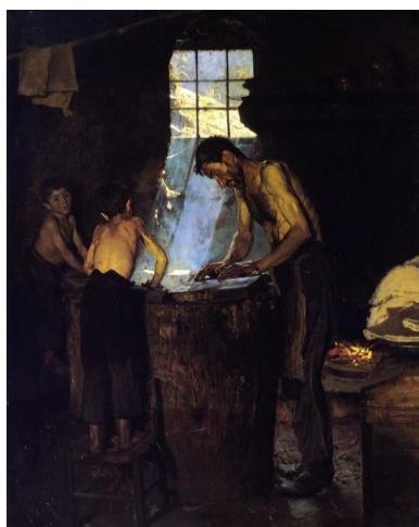
圖 4 索倫·柯羅耶，〈義大利鄉村帽匠〉， 1880，油彩、畫布， 135.3×107 cm，赫施普朗博物館。

有大批觀眾在羅馬圓形競技場中，梅薩琳娜擁有自己的包廂，華麗雕飾及東方地毯的細節，展現著他同時保有對高貴的歷史人物題材的掌握。