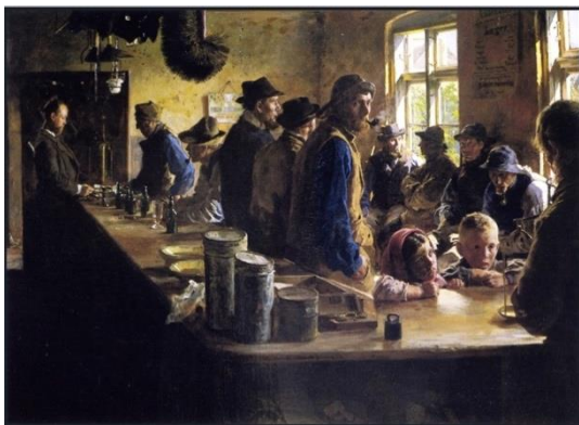
圖 30 索倫·柯羅耶，〈捕魚休息的商店裡〉，1882，油彩、畫布，79.5×109.8 cm，赫施普朗博物館。