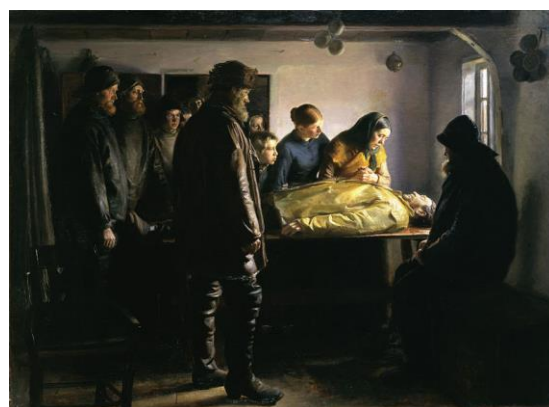
圖 18 邁可·安切爾，〈溺死的漁夫〉，1896，油彩、 畫布，212.5×289 cm，斯卡恩博物館。

邁可雖透過臨摹柯羅耶的作品嘗試新的繪畫風格，但並非從此不變，後期許多作品仍保留慣常使用的古典技法。1896年〈溺死的漁夫〉【圖 18】是他最後一幅以漁民為主要人物的畫作。此作描繪的是一起發生於 1894 年的悲劇事件：兩名斯卡恩漁民溺水身亡，其中一位是年輕人，另一位則因曾經