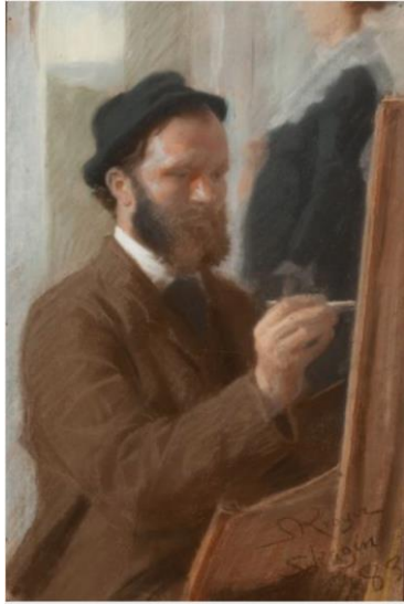
圖 7 索倫·柯羅耶，〈邁可·安切爾畫安娜·安切爾站在門口〉，1883，粉彩、紙，尺寸不詳，斯卡恩博物館。