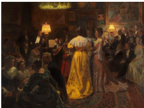
圖 26 勞瑞茲·圖森，〈工作室的派對〉，1905，油彩、畫布，125×167 cm，斯卡恩博物館。