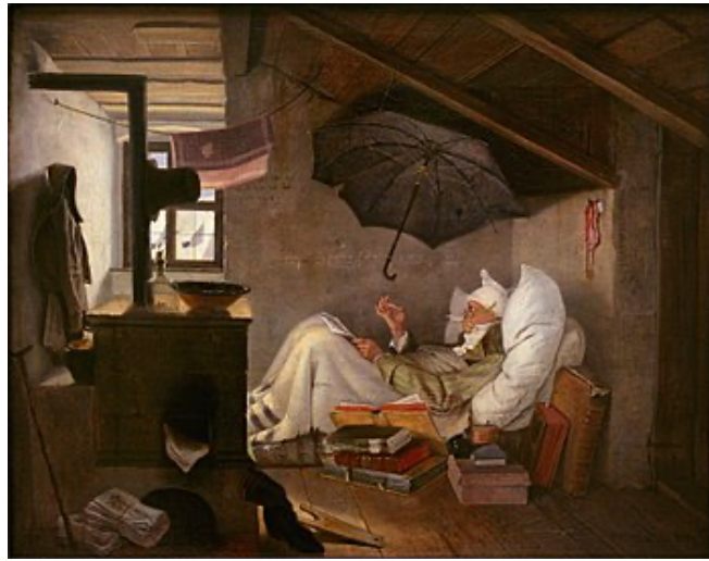
圖 2 施皮茨韋格，〈窮詩人〉，1839， 36.2x44.6cm，油彩、畫布，慕尼黑新繪畫陳列館。

當然早期德國的浪漫派對於「反思」的理解並不全然與費希特相同，費希特將自我行動(Aktion des ich)的無限性排出在理論哲學外，隸屬於實踐哲學；而浪漫派則要使自我行動對理論哲學甚至整個哲學領域都有建構意義。有趣的是，弗里德里希·施萊格爾的幾乎所有思想和研究都仿佛刻意避開了實