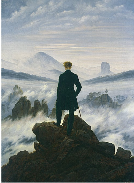
圖 1 弗里德里希，〈雲端上的旅人〉，1818， 95x75cm，油彩、畫布，漢堡美術館。